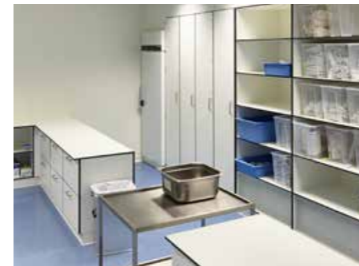
Clean room furniture