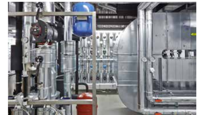
Technical plant room