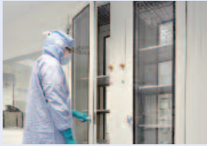
Reinraumsystem mit aktiven Materialschleusen